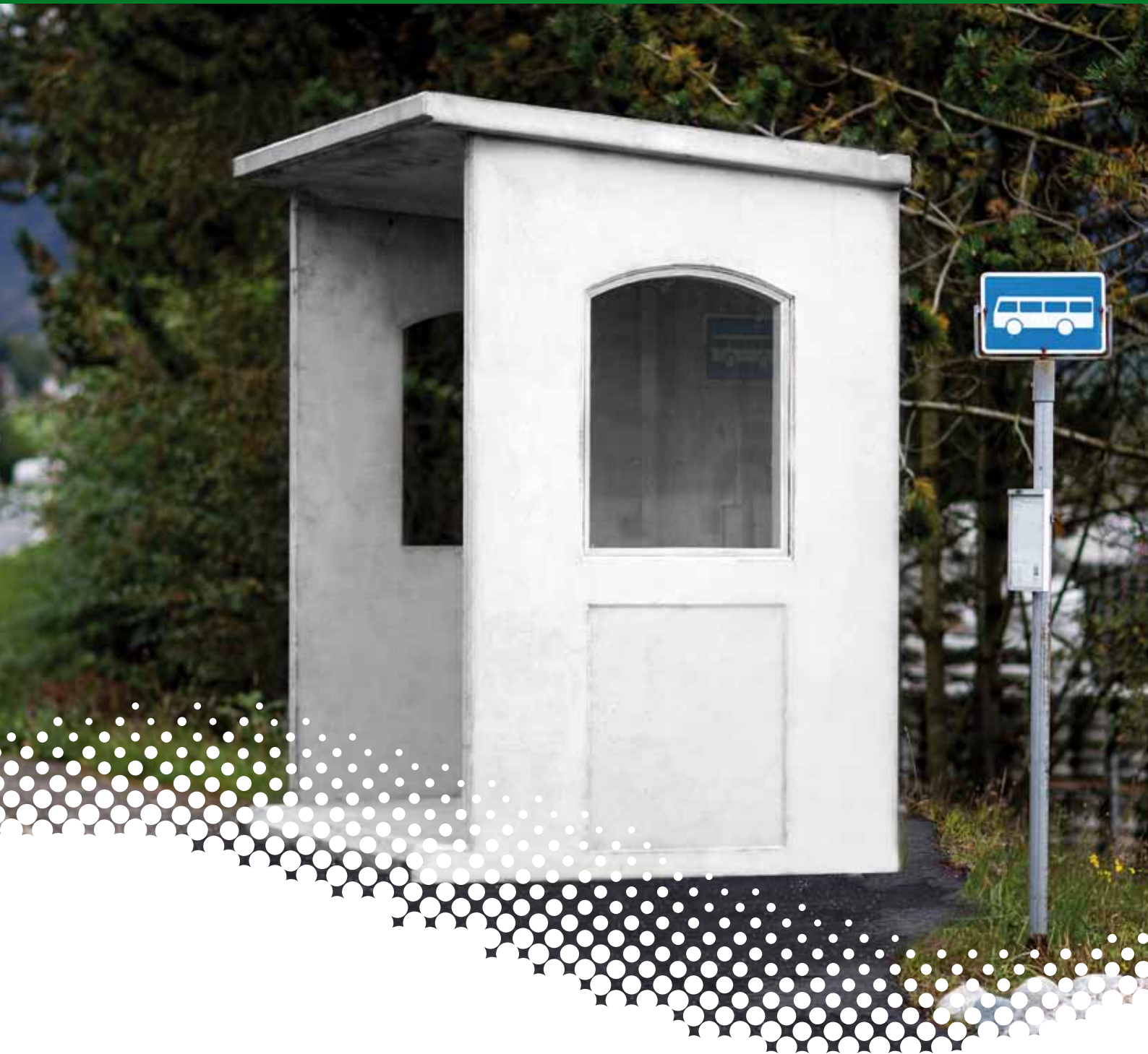
BUSSKUR MODELL ØLENSVÅG